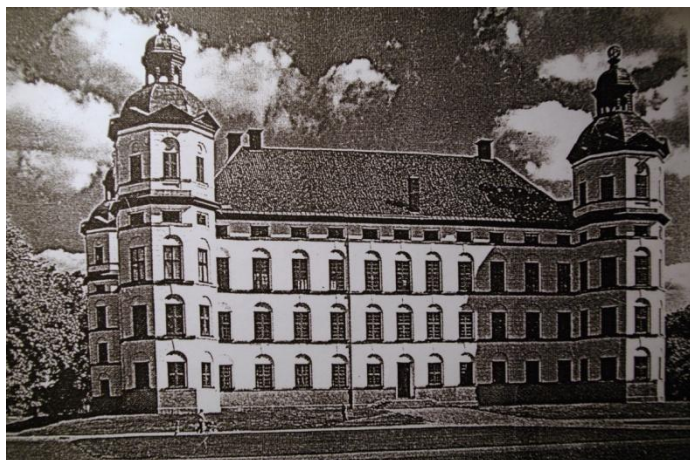
Skokloster slott från sjösidan