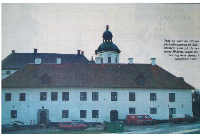
Skoklosters gamla slottet där Karl Gustaf Wrangel är född