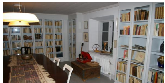
Fridegårdsrummet i medeltidsbuset